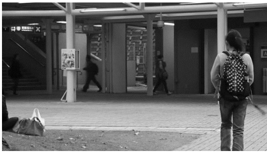
شکل (۶): نمونه‌ای از فریم ناهنجاری تشخیص داده شده