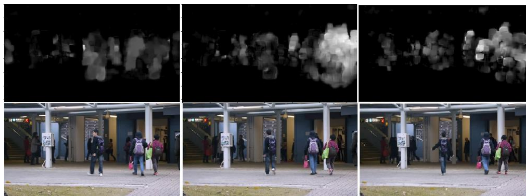
شکل (۲): سه نمونه از تصاویر شار نوری همسان‌سازی شده بین صفر و یک (ردیف بالا) و فریم مربوطه به آنها (ردیف پایین)