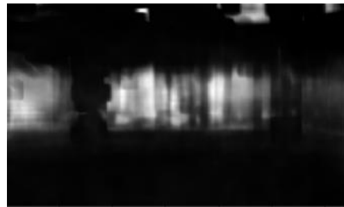
شکل (۳): نقشه حرکت فریم‌ها بعد از پردازش با عمل مورفولوژیک سایز

برای استخراج میزان کاهش آستانه، با استفاده از حلقه For حالات مختلفی بررسی شدند و سیستم با مقادیر مختلف کاهش آستانه تست شد. برای این کار، تمام مقادیر ممکن از کاهش ۳ درصدی تا کاهش ۵۰ درصدی با دقت ۱ درصد تست شدند و بهترین نتایج با دقت یکسان برای بازه ۱۴ درصد تا ۱۷ درصد حاصل شد که برای مقاله، مقدار ۱۵ درصد استفاده شد و با آزمایشی مشابه تعداد بلوک، حداقل